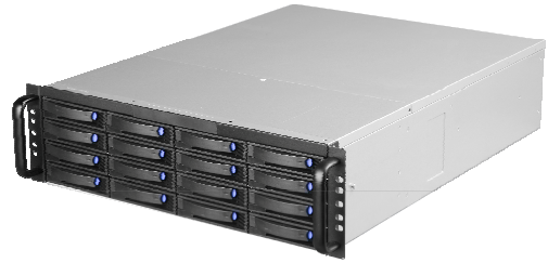
(磁盘阵列不含硬盘)